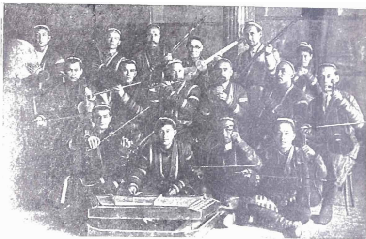
Ўзбек халқ чолғу асбоблари ансамбли.