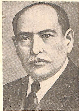
Коммунистик партия ва Совет давлатининг атоқли арбоби Наримон Наримонов.

Ёзувчилардан Сулаймон Соний Охундов, Абдурахим Ахвердиев, революцион сатирик Мирза Алекпер Собир, «Мулла Насриддин» номли адабий-сатирик ва ижтимоий - сиёсий журнал ношири, революцион демократ Жалил Мамадқулизода ва бошқа кўпгина кишилар демократик адабиётнинг атоқли намояндалари эдилар. Халқнинг шонли фарзандлари Ҳасанбек Маликов (Зардобий) ва Наримон Наримонов